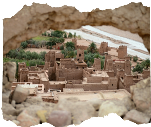
Ait Ben Haddou