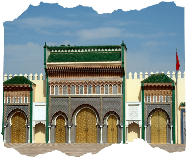
Royal Palace Of Fez