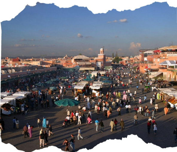
Jema El Fena'Square