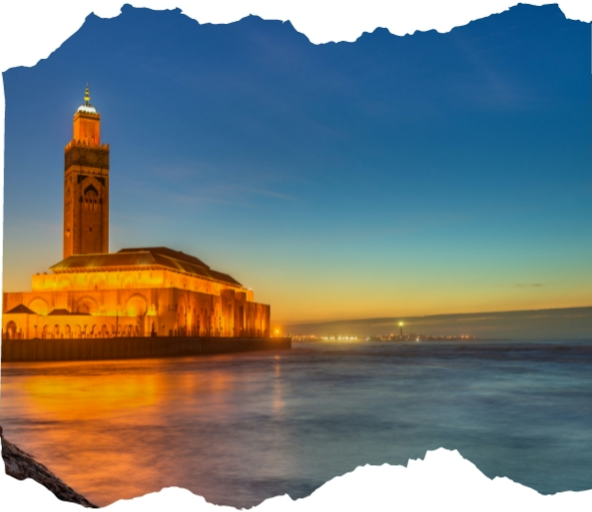
Hassan Sani Mosque