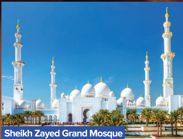
Sheikh Zayed Grand Mosque