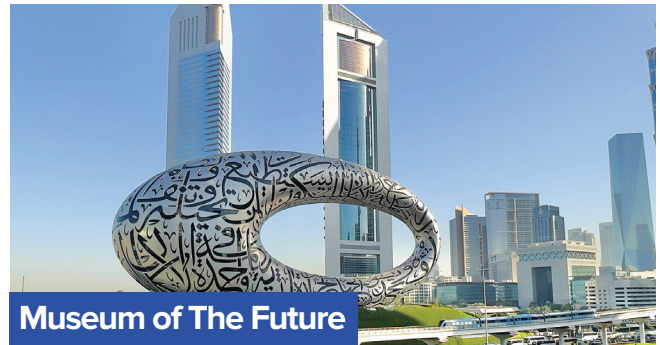
Museum of The Future