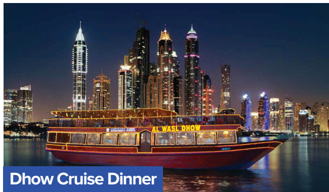
Dhow Cruise Dinner